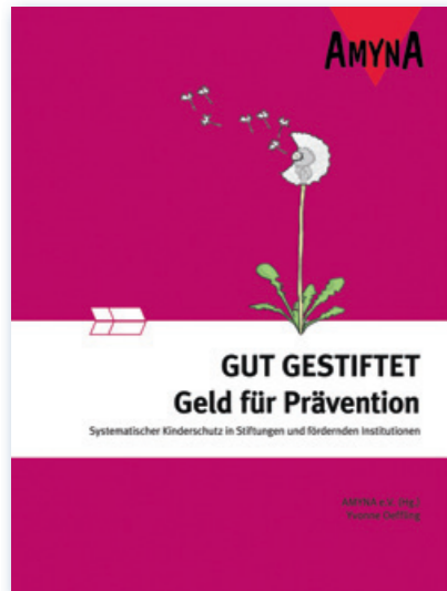
GUT GESTIFTET – Geld für Prävention Systematischer Kinderschutz in Stiftungen und fördernden Institutionen

GUT GESTIFTET bietet Stiftungen verschiedene Hilfestellungen, damit sie einen wichtigen Beitrag zur Prävention von sexuellem Missbrauch leisten zu können.